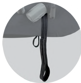
fig.5: Fascia poggipiedi

Dotata di sistema aggrappante ad uncino lungo la superficie inferiore, al fine di potersi agevolmente fissare lungo la superficie superiore dell'elemento inferiore. Lungo le sue estremità, la fascia, sarà dotata di due simil anelli in materiale morbido e flessibile regolabili, per alloggiare i piedi dell'utilizzatore finale.