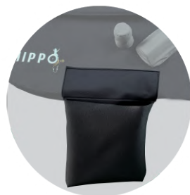
fig.6: Sacca porta oggetti

Dotata di sistema aggirante lungo la superficie inferiore, al fine di potersi agevolmente fissare lungo la superficie superiore dell'elemento inferiore.