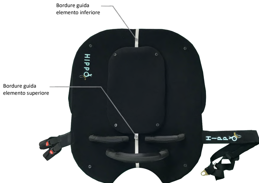
fig.3: Elemento superiore

Questa operazione contribuisce allo scarico del peso dell'utilizzatore finale sul cavallo, oltre che ad un maggiore comfort per l'utilizzatore finale stesso.