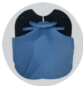
fig.7: Rivestimento igienico di copertura

E' dotato di sistema aggirante lungo la superficie inferiore, al fine di potersi agevolmente fissare lungo la superficie superiore dell'elemento inferiore.