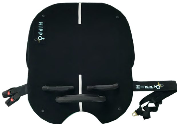
fig.2: Elemento inferiore

L'elemento inferiore (fig.2) deve essere il primo componente ad essere posizionato, esso è creato con un particolare materiale in grado di fare grip sul pelo del cavallo. Una volta posizionato, utilizzare il sottopancia, adeguatamente stretto, per fissare il pad posturale modulare evitando che lo stesso si sposti durante il trattamento riabilitativo.