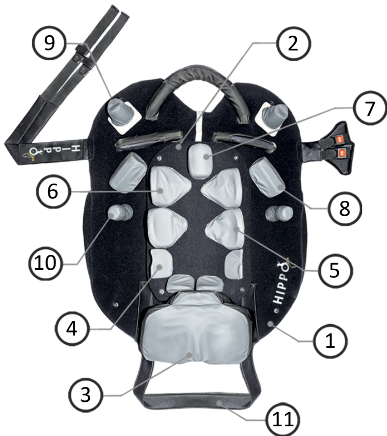
fig.1: Componenti pad posturale modulare Hippo MB